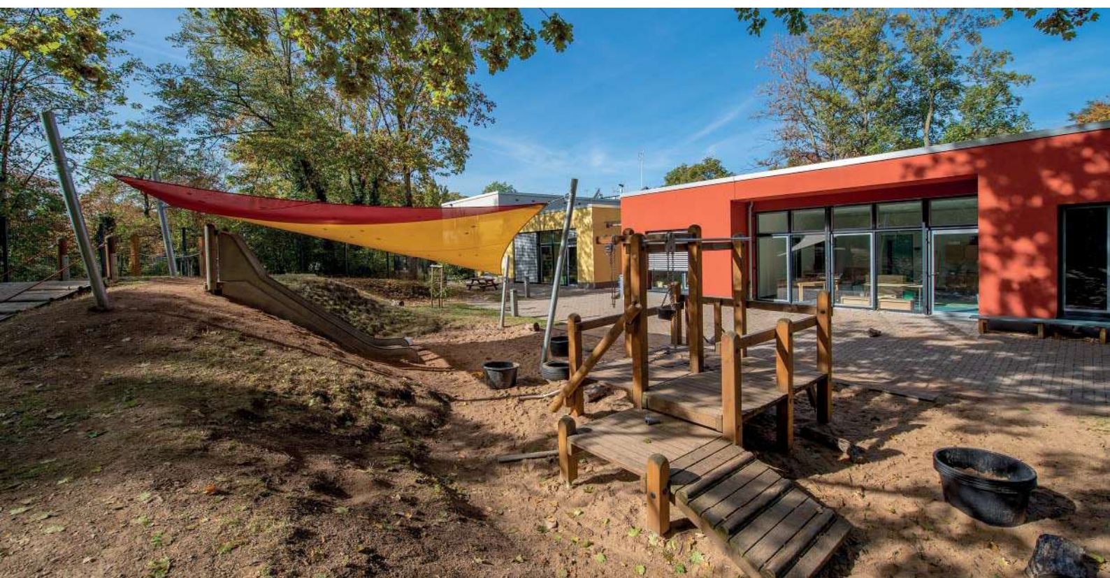
„Kita Auf dem Hügel“ Studierendenwerk Bonn